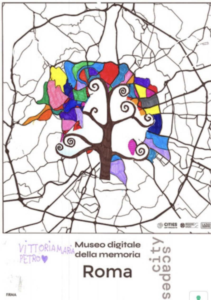
Figura 3. Una mappa immaginaria dei bambini.

ogni cittadino deriverebbe la propria immagine mentale della città e il proprio rapporto con lo spazio urbano: «La qualità che conferisce ad un oggetto fisico una elevata probabilità di evocare in ogni osservatore una immagine vigorosa. [...] Essa potrebbe venir denominata leggibilità o forse visibilità in un significato più ampio, per cui gli oggetti non solo possono esser veduti, ma anche acutamente ed intensamente presentati ai sensi» (Lynch 1960: 31-32).