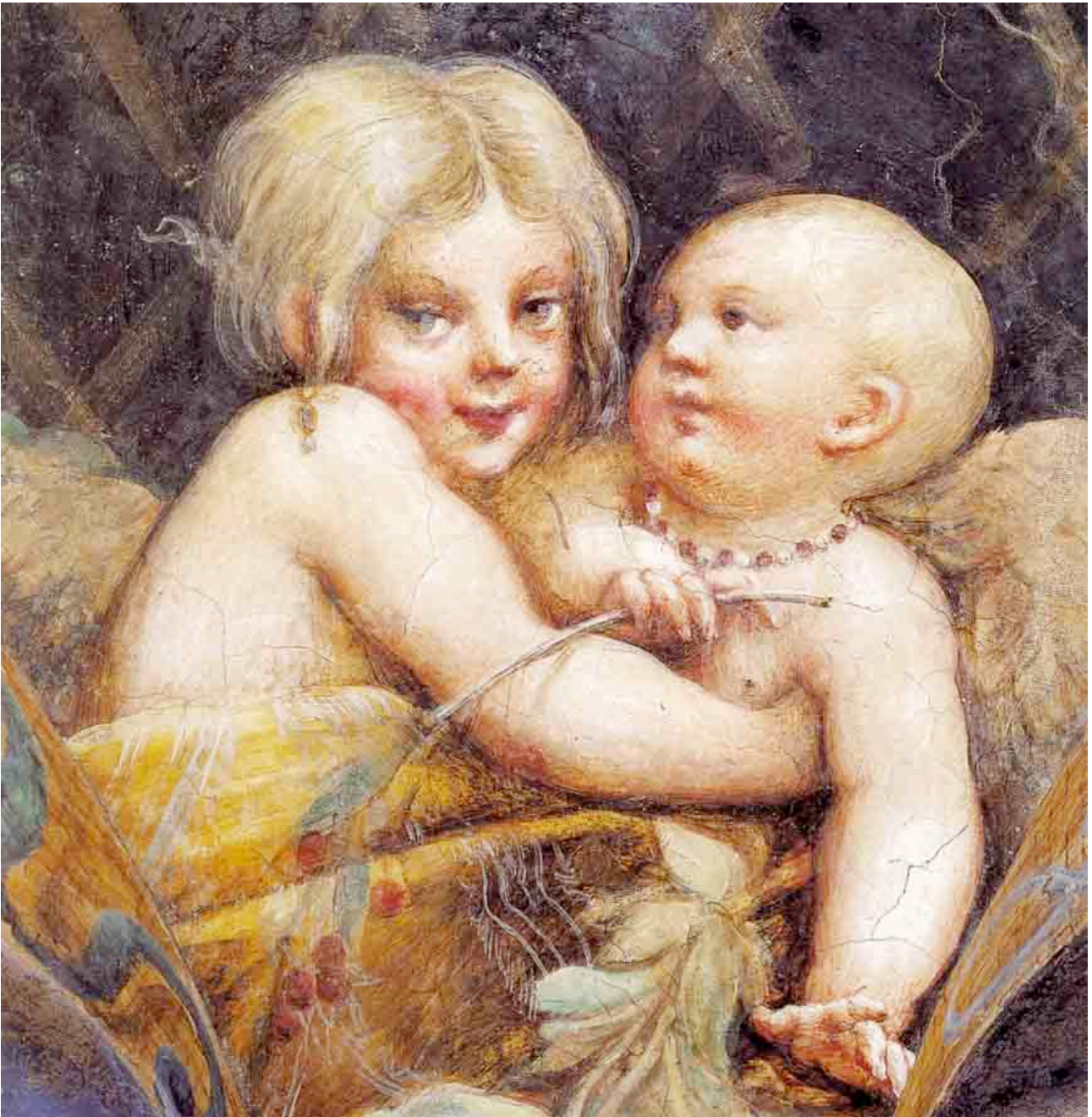
Fig. 4 – Parmigianino Diana e Atteone – particolare (1524)

Gli esempi sono numerosi, e la loro elencazione si trasformerebbe in una lunga lista, ma tra questi alcuni sono così marcati da risultare persino ironici. È il caso di un'opera di Filippo Lippi, i Sette Santi (tardi anni cinquanta del '400) [fig. 5], una tempera su tavola nella quale sette santi, appunto, seduti uno di fianco all'altro su di un lungo sedile di marmo, pregano e "dialogano" in silenzio, sostanzialmente assorti. Tutti tranne uno: Pietro Martire, l'ultimo sulla destra per chi guarda, che si direbbe annoiato, o almeno è quanto suggeriscono la postura e lo sguardo rivolto all'esterno del quadro. L'atteggiamento è quello del modello che, ormai stanco di mantenere la posizione, osserva l'artista al lavoro in attesa di un cenno.