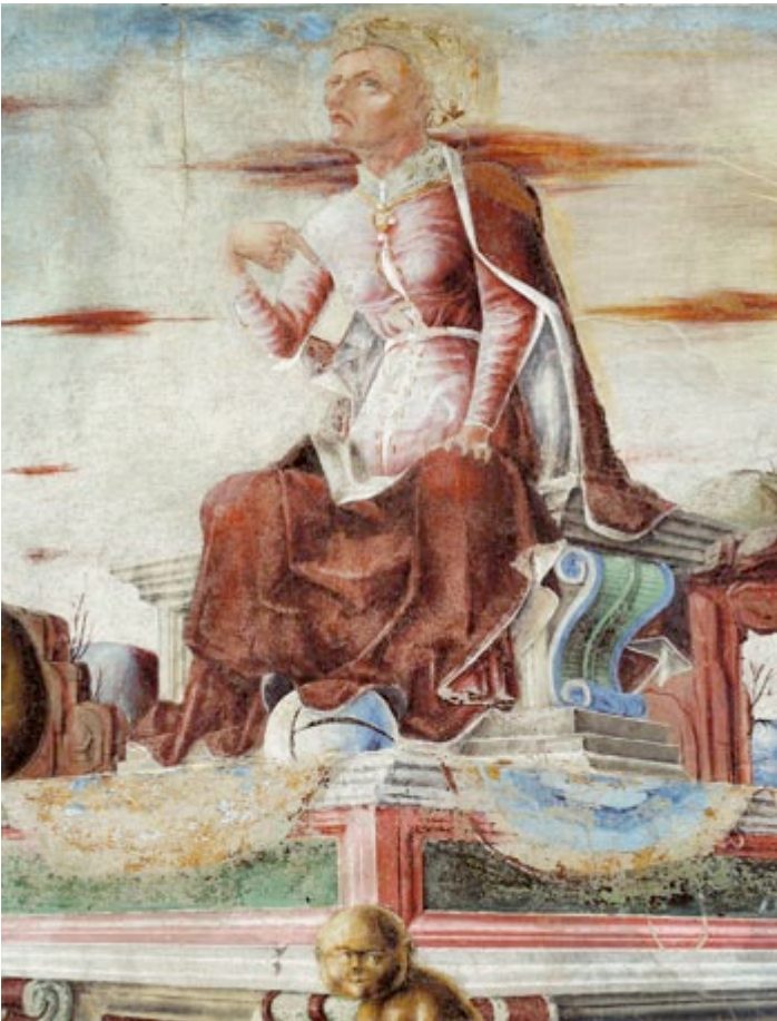
Fig. 6 - Ercole de Roberti Palazzo Schifanoia – Settembre particolare

Al dunque, vi sarebbe un artista in fuga dalla historia albertiana (dalla narrazione rappresentata e dall'idea che "solo studia il pittore fingere quello che si vede") grazie a un sistema escogitato per intervenire su di una parte dell'opera e farne, con volitivo atto di 'presenza', il segno della propria autoconsapevolezza culturale. In conclusione l'artista non si sarebbe impegnato a lasciare semplicemente testimonianza di sé e del proprio status sociale, seppur con un oggetto molto sofisticato come un autoritratto o una firma, ma si sarebbe anche prodigato (sfruttando figure minori e minime) per affermare altrimenti il proprio ruolo, per esplicitare una funzione di primaria importanza perché demiurgica, sulla quale richiamare con discrezione e sagacia linguistica una diversa attenzione.