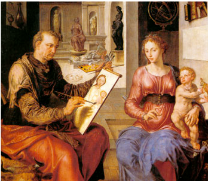
Fig. 3 - Maarten van Heemskerck San Luca dipinge la Vergine (1532)

dell'affermazione personale, mettendo in scena un pittore intento a dipingere una donna col bambino, mentre essa (e in entrambe le opere) fissa al di fuori del quadro. È cioè la stessa modella a sconfessare il pittore raffigurato all'interno guardando il vero artefice, il pittore al di fuori del quadro. L'artista rivela in tal modo, e in un sol colpo, la sua presenza all'esterno del quadro e il carattere d'artificio dell'intera composizione 15 . A sostegno di un atteggiamento sospettoso nei confronti delle vere intenzioni di Heemskerck, osservando ciò che il Santo sta dipingendo si può notare che sul "quadro" nel quadro la Vergine ha il capo rivolto verso il bambino, in una direzione differente rispetto a quella dell' ammonitore .