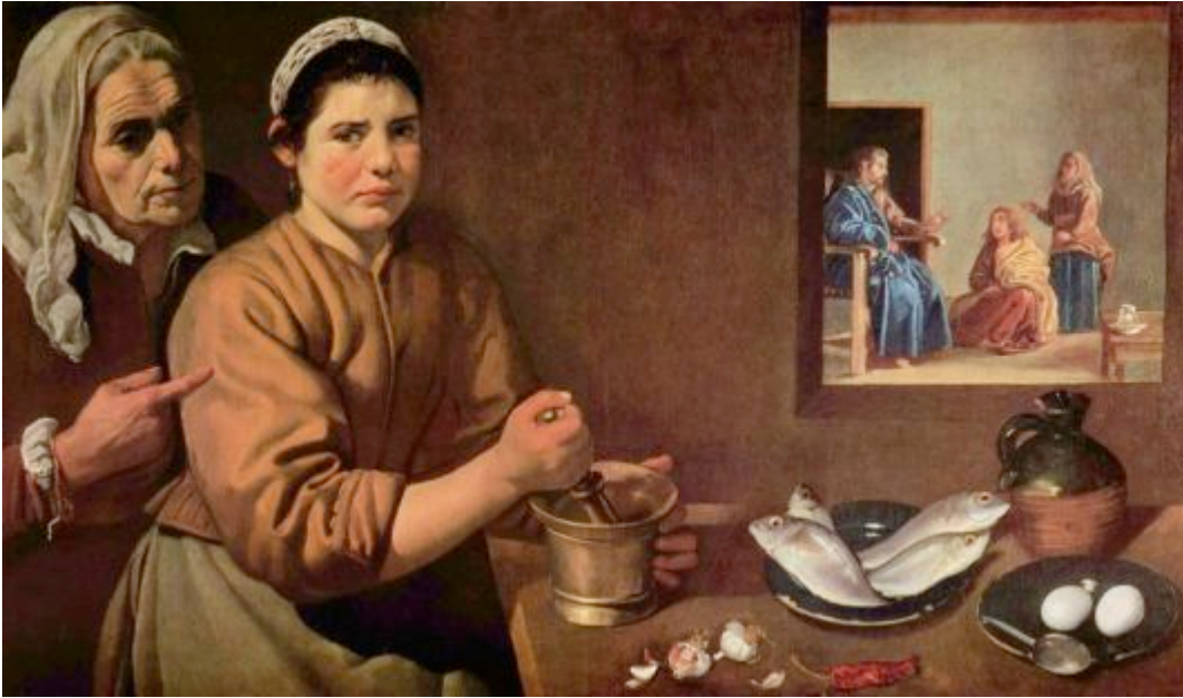
Fig. 2 - Diego Velázquez Cristo in casa di Marta e Maria (1620 c.)

Procedendo a ritroso nel tempo s'incontra un quadro di Velázquez, Cristo in casa di Marta e Maria [fig. 2], tuttora foriero di discussioni e osservazioni.