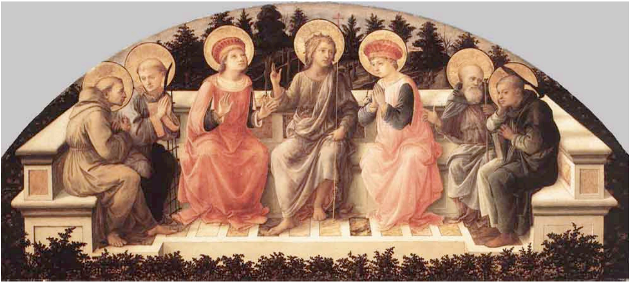
Fig. 5 - Filippo Lippi Sette Santi (1450 c.)

Qui potremmo fermarci, tuttavia abbiamo iniziato con un gatto nero, e con un altro animale sembrerebbe opportuno chiudere il cerchio. Lo si vede nelle decorazioni di Palazzo Schifanoia (iniziate nel 1467), ed è quanto di più basso e istintuale riesca a pensare la cultura dell'epoca: una scimmia. Visibile nella fascia superiore dello scomparto di Settembre [fig. 6] realizzato da Ercole de Roberti, è seduta sul carro di Vulcano trainato da altri primati come lei, però imperturbabili e con lo sguardo fisso in avanti,. Non è irritata come il gatto di Manet, ma rivolge lo sguardo al di fuori dell'opera con espressione, verosimilmente data la sua natura, incuriosita.